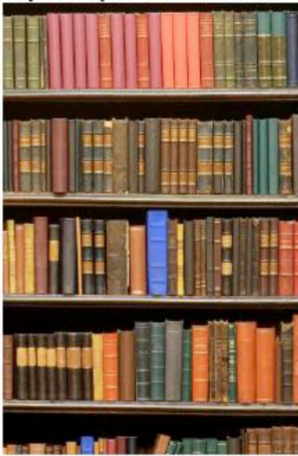
90 th percentile

Student "A" reads 20 minutes each day 3600 minutes in a school year 1,800,000 words